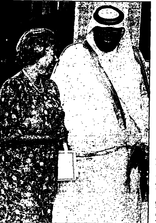
الملكة اليزابيث ترحب بالشيخ حمد في قصر باكنجهام

لندن - القدس العربي: أكد المتحدث باسم الحكومة البريطانية لمارك سبيكس في بيان له ان الملكة اليزابيث الثانية قد منحت امير قطر الشيخ حمد بن خليفة آل ثاني لقب فارس في حفل اقيم في قصر باكنجهام في لندن في 14 يونيو 2007. وقال سبيكس ان الملكة اليزابيث الثانية منحت امير قطر لقب فارس في حفل اقيم في قصر باكنجهام في لندن في 14 يونيو 2007. وقال سبيكس ان الملكة اليزابيث الثانية منحت امير قطر لقب فارس في حفل اقيم في قصر باكنجهام في لندن في 14 يونيو 2007.